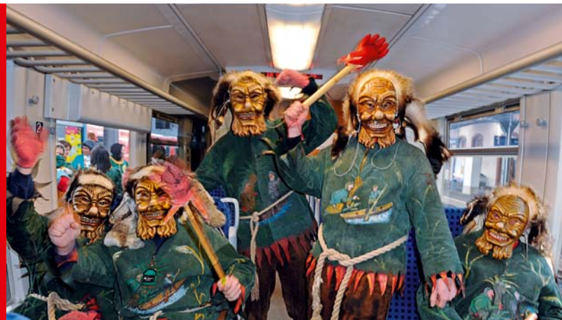
Tradition & Brauchtum

Rein ins närrische Treiben – auf zu den Fasnachtshöhepunkten in Ihrer Region.